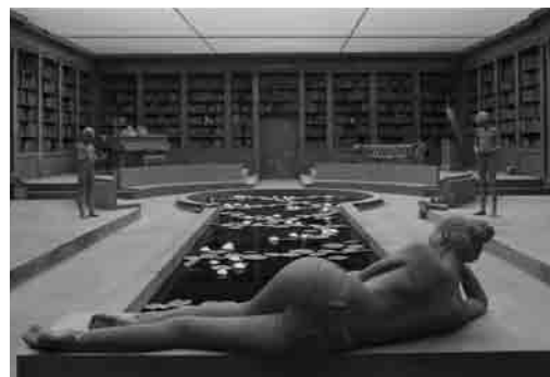
p. 27 (6)

'Works' is het lijvige kunstboek dat werd gepubliceerd naar aanleiding van de tentoonstelling 'Hans Op de Beeck: Out of the Ordinary' in het Kunstmuseum Wolfsburg de voorbije zomer. De kunstenaar zegt zelf dat het een volkomen subjectief overzicht van zijn oeuvre is: 'I ask you to bear with any imperfections'. Net daardoor is het zo sterk, hij vertelt hoe hij besefte dat hij als kunstenaar kon functioneren tijdens zijn periode aan de Rijksakademie in Amsterdam, waar hij de inspirerende Michelangelo Pistoletto als gastlector had. 'That was a tremendous encouragement. Today people like Michelangelo have become my colleagues; we are presented by the same gallery, and exhibit in the same places. I still can't quite believe it.'