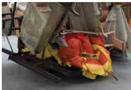
p. 27 (4)

Over de aard van zijn werk en de titels die hij eraan geeft zegt hij zelf: 'I have respect for the worthless, the inutile. Everything is worthy of a proper name, a personal name, a unique alias that distinguishes each individual object, every living creature, each event.' Dat lijkt haaks te staan op de kleine, grote en gigantische objecten die hij maakt en die opgebouwd worden uit afval, sloopresten, stof afkomstig uit stofzuigerzakken en andere 'minderwaardige' materialen ... Net die titels geven de werken een extra dimensie. Hans Theys schreef ooit over zijn werk: (H ART 26.03.2009): 'De sculpturen van Peter Buggenhout berichten over de werkelijkheid op dezelfde manier als bomen, koraalriffen of wolken dat doen: door er deel van uit te maken. Maar het gebeurt op een lichtjes verschillende manier, doordat ze door iemand gemaakt zijn (...): poëtische